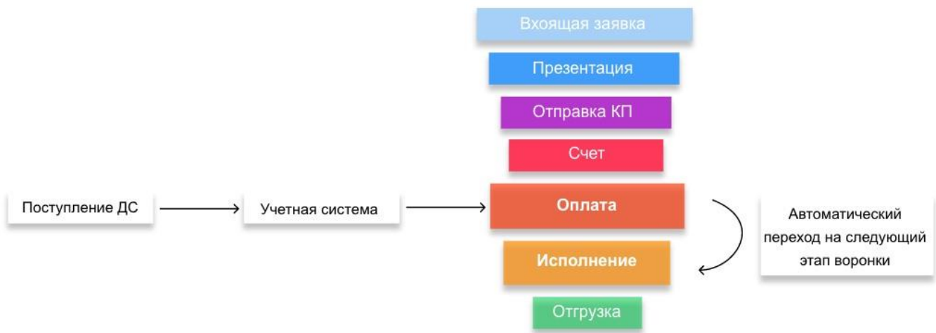
пример автоматической воронки продаж